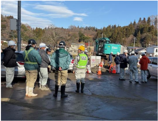
北須川河川海岸維持管路工事現場

12月5日及び12月8日、管内の工事現場において、RST須賀川が、現場パトロールを実施しました。RST須賀川は、平成12年11月に福島県建設業協会の須賀川支部・石川支部会員企業で設立し、工事現場の安全パトロールや研修会を中心に活動を行っています。会員数は19社で、当協会が事務局となっています。12月5日は、須賀川市発注の工事現場、12月8日は、県発注の工事現場をRST須賀川、須賀川労働基準監督署、須賀川市役所、県中建設事務所、県建設業組合のメンバーでパトロールを実施しました。パトロール実施後、須賀川建設会館で好事例及び改善点等を発表し講評を行いました。