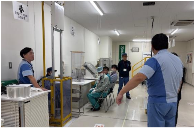
静電気による災害体験