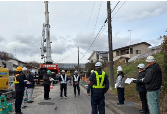
笹平川函渠新設工事現場