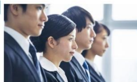
労働基準監督官 採用試験 2025 Labour Standards Inspector Exam 2025

福島労働局 HP に労働基準監督官の 2025 採用パンフレットを掲示するとともに、 2025 労働基準監督官採用試験募集要項が発表 されましたのでお知らせします。